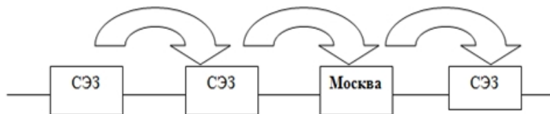
Рис. 4. Сеть СЭЗ в рамках Стратегии Экономического пояса Шелкового пути, пролегающая через Россию

Несомненно, что перспективы сотрудничества России и Китая в рамках Стратегии Экономического пояса Шелкового пути очевидны. И именно таможенный регулятор может стать решающим фактором в изменении ситуации. Изучив данную проблему, мы сформировали соответствующие предложения реализации Стратегии с учетом решения таможенных вопросов. Первое предложение касается создания сети Свободных экономических зон. Схематично такую сеть можно представить следующим образом (см. рисунок 4):