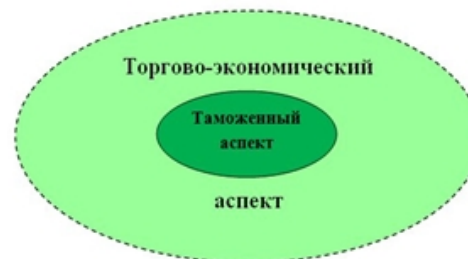
Рис.2. Таможенный аспект как часть торгово-экономического аспекта деятельности

Рассматривая проблему сотрудничества можно целенаправленно говорить о двух аспектах развития взаимоотношений Китая и России: торгово-экономическом и таможенном, наиболее важном в рамках исследования. В данном случае проблема таможенного развития является следствием торгово-экономической проблемы. Более детально постановку проблемы можно рассмотреть на схеме (см. рисунок 2).